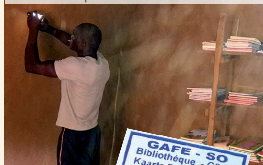
Installation de lampes solaires.

La bibliothèque va constituer un atout important pour soutenir l'action de l'école, dans une région où le livre est très peu accessible et où les équipements collectifs manquent cruellement.