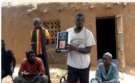
L'instituteur du village explique l'importance des livres.