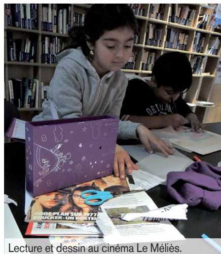
Lecture et dessin au cinéma Le Méliès.

Le 28 juillet dernier, douze familles roms ont été expulsées du lieu qu'elles occupaient depuis six ans à Montreuil. Le campement a été intégralement déplacé et décrété illicite, sans que la moindre alternative n'ait été proposée. Cette population stigmatisée vit aujourd'hui dans la rue, dans des conditions inhumaines, et sans aucune considération pour la situation scolaire des enfants. L'association Asphalté et ses militants entreprennent des actions de soutien à destination de ces enfants déscolarisés et dispensent des séances de lecture et de dessin dans le cinéma « Le Méliès ».